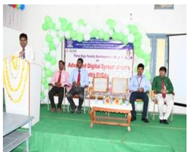
Principal addressing the participants @ FDP