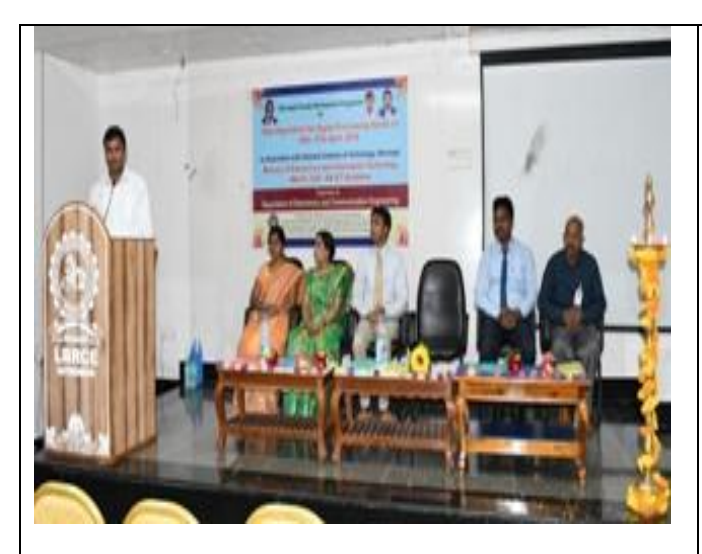
A snapshot of the inaugural @ FDP