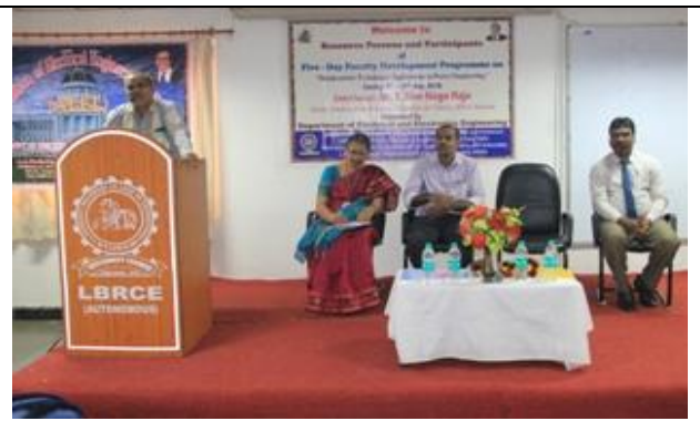
A snapshot of the valedictory function @ the FDP in EEE